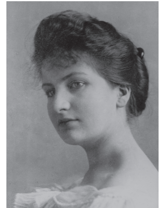
Alma Mahler (von 1902 bis 1911 Gustav Mahlers Ehefrau), Porträtfoto um 1902.