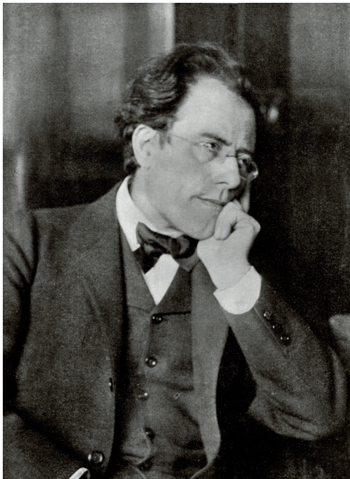
Gustav Mahler, Porträtfoto um 1905.

legt, um sie vorzuführen. In ihrer Fehlbelichtung wirken die Postkartenmotive nicht mehr idyllisch, sondern verstörend.