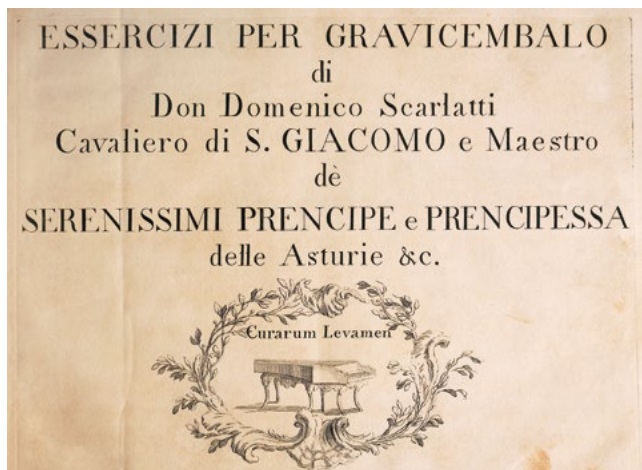
Titelblatt der »Essercizi per gravicembalo« von Domenico Scarlatti, 1738.

Obwohl Arcangelo Corelli nie selbst in England war, haben seine Werke dort über Jahrzehnte, ja Jahrhunderte, eine besonders treue Fangemeinde. Ein Grund sind die vielen Laienmusiker im Land. Sie ergötzen sich im kleinen Kreis an Corellis Triosonaten und spielen – mit professioneller Verstärkung im concertino – groß besetzt seine Concerti grossi. Der Corelli-Schüler Francesco Geminiani hat in England als erster die Idee, auch dessen Triosonaten zu Concerti grossi zu »boostern«. Einheimische Komponisten folgen und schaffen bis weit ins 18. Jahrhundert Beiträge zu dieser Gattung, als man sich südlich des Ärmelkanals längst schon ganz anderen Formen zugewandt hat. Eine ebenso tollkühne wie geniale Geschäftsidee hat dabei Charles Avison. Von einem kurzen