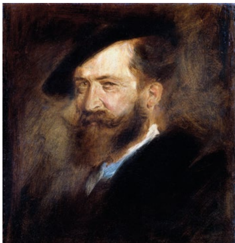
Wilhelm Busch, Porträt von Franz von Lenbach, um 1877.

Hindemiths Witz begegnen wir über seinen eigenwilligen musikalischen Humor hinaus auch in seinen Briefen, Schriften und gern zitierten ironischen Bemerkungen. Hindemith war wie Wilhelm Busch zudem ein begabter Zeichner und Karikaturist, der auf alle möglichen Zettel, ja selbst in die Noten, kleine Bildchen zeichnete. Dass er in jungen Jahren sogar einmal plante, eher parodistische Stücke und Unterhaltungsmusik schreiben zu wollen, ging in dieselbe Richtung. Ein Blick in sein Werkverzeichnis lässt schnell erkennen, dass er beispielsweise mit seinem »Gouda-Emmental-Marsch«, seiner Musik für sechs Instrumente und einen »Umwender« oder mit seiner schrägen »Ouvertüre