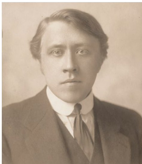
André Caplet, Porträtfoto aus dem Jahr 1910.