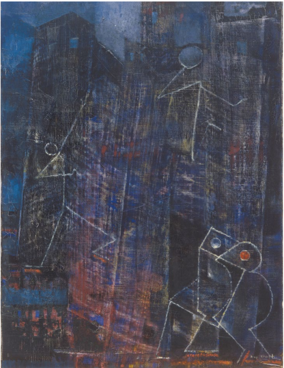
Max Ernst, »Rock'n Ruin«, um 1958/59, Sprengel Museum Hannover

Max Ernst (1891 – 1976) war einer der wichtigsten Vertreter des Dadaismus und Surrealismus. Als Maler, Grafiker und Bildhauer entwickelte er eine sehr eigene Bildsprache. Das kleinformatige Gemälde »Rock'n Ruin« aus seinem Spätwerk zeigt eines der wichtigsten Motive seiner persönlichen Ikonographie. Es ist die zeichenhafte und zugleich phantastische Umdeutung des Vogels als eine metaphorische und symbolhafte Darstellung von Liebe und Tod. Das Geheimnisvolle des Bildes veranschaulicht sich auch in der Maltechnik selbst. In einem Kombinationsverfahren wird die Leinwand traktiert. Die Farbe wird weggeschabt und gekratzt, um darunterliegende Farbschichten zum Vorschein zu bringen, und es wird mit mechanischen Hilfsmitteln hineingestempelt.