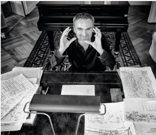
Komponist Jörg Widmann an seinem Schreibtisch.

Eine von starken Kontrasten und großer struktureller Vielfalt lebende Musik schreibt auch der 1973 geborene Komponist, Klarinettist und Dirigent Jörg Widmann, der seit der Saison 2023/24 Erster Gastdirigent der NDR Radiophilharmonie ist. In seinem reichen Schaffen hat er von Kammermusik, großen Orchesterwerken bis hin zu seinem einst für die Eröffnung der Elbphilharmonie geschriebenen Oratorium »Arche« mit allen möglichen Instrumenten und Klangfarbenmischungen experimentiert. In seinen 24 Duos für Violine und Violoncello – die Zahl 24 hat wegen der von Bach begründeten, aber auch von zeitgenössischen Komponisten fortgeführten Tradition von 24 Präludien und Fugen eine gewisse Magie – konzentrierte er sich eigenen Aussagen zufolge auf die »Ungeschütztheit und Reduziertheit« dieser Streicherkonstellation. Es sind