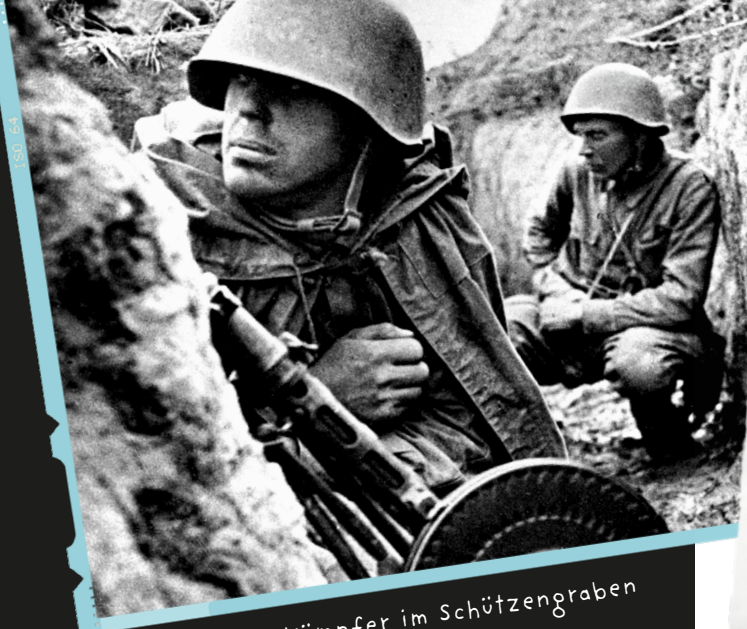
Sowjetische Kämpfer im Schützengraben vor Leningrad, September 1941

„Vor einer Stunde habe ich den 2. Satz meines sinfonischen Werks abgeschlossen. Sofern mir die Komposition gut von der Hand geht und es mir gelingt, den 3. und 4. Satz fertigzustellen, wird es meine 7. Sinfonie sein. Weshalb ich Ihnen das mitteile? Damit die Hörer:innen wissen, dass das Leben in unserer Stadt normal verläuft. [...] Wie alle anderen Bürger:innen Leningrads erfüllen auch die Kulturschaffenden ehrlich und selbstlos ihre Pflichten. [...] Ich versichere Ihnen im Namen aller Kulturschaffenden und Künstler:innen Leningrads, dass wir unbesiegbar sind und unseren Posten nicht verlassen.“