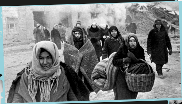
Leningrader:innen verlassen zerbombte Häuser, Dezember 1942