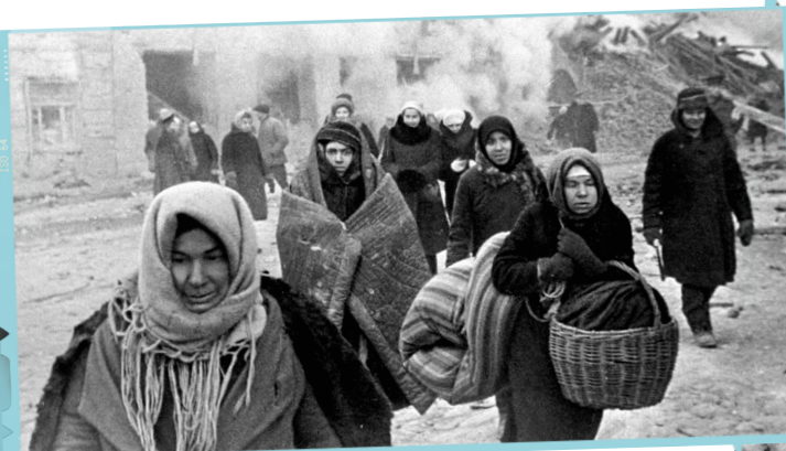
Leningrader:innen verlassen zerbombte Häuser, Dezember 1942