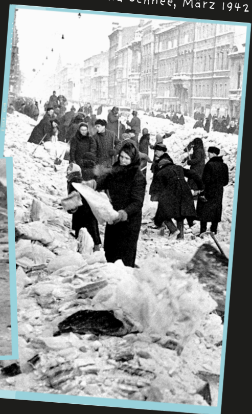
Leningrader:innen befreien Straßen von Eis und Schnee, März 1942

Doch zum Schutz aller Künstler:innen im Land wurde er abgelehnt. Ob Schostakowitsch wirklich an die Front wollte, lässt sich heute nicht zweifelsfrei sagen. Fakt ist aber, dass diese Meldung durch die Medien ging und ihm vielleicht zum ersten Mal echten Schutz schenkte. Seit Stalins Machtantritt gehörte auch er zu den politischen Gegnern „im Inneren“. Nun lag der Fokus aber auf dem Kampf des Gegners „im Außen“.