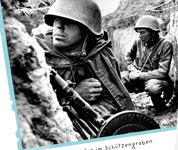
Sowjetische Kämpfer im Schützengraben vor Leningrad, September 1941

Faschismus ist eine politische Bewegung, die rechtsextreme, rassistische und fremdenfeindliche Gedanken vertritt. In der Geschichte erstarkte der Faschismus immer dann, wenn es Menschen wirtschaftlich nicht gut ging und/oder sie sich nach einer starken Führung sehnten. Folgen des Faschismus sind totalitäre Regime, Unterwerfung und totaler Gehorsam aller sowie die Negierung des Individuums.