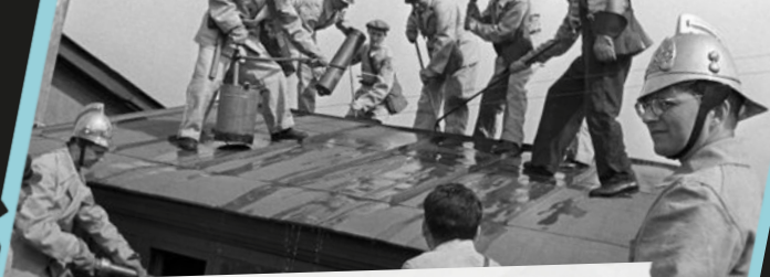
Schostakowitsch auf dem Dach des Leningrader Konservatoriums, 1941

In den Jahren 1936 bis 1938 ließ Stalin in der Sowjetunion großflächige Säuberungen durchführen, in denen politische Gegner:innen, Andersdenkende und auch viele Kulturschaffende ermordet wurden. „Es gilt nicht nur den äußeren, sondern auch den inneren Gegner zu bekämpfen.“ In dieser Zeit ließ Stalin auch mehrere führende Militärs hinrichten, angeblich wegen politischer Unterwanderung.