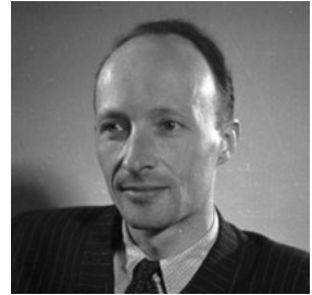
Witold Lutosławski (1946)

Doch bis es soweit war, galt es Kompromisse zu schließen. Wie viele seiner Kollegen half sich auch Lutosławski durch Einbeziehung von Volksmusik. Sie sollte die von der Kulturbürokratie geforderte Verständlichkeit garantieren. Allerdings greift das „Konzert für Orchester“ – im Unterschied zu manchen Gelegenheits- und Brotarbeiten Lutosławskis – polnische Folklore nur recht oberflächlich auf: Melodien aus Masowien, der Gegend um Warschau, dienen lediglich als Rohmaterial. Sie werden mit neuen Harmonien, atonalen Kontrapunkten und neobarocken Satzformen kombiniert und haben daher eher geringen Einfluss auf die endgültige Gestalt der Musik. Elegant umging Lutosławski so die ihm auferlegten Beschränkungen und schrieb ein anspruchsvolles, persönlich gefärbtes Werk.