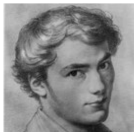
Der junge Franz Schubert (Zeichnung von Leopold Kupelwieser)

Was der genauere Blick ins Werk offenbart? Dass Mozart mehrfach dezent zitiert wird. Dass einiges, was zunächst so unscheinbar in der langsamen