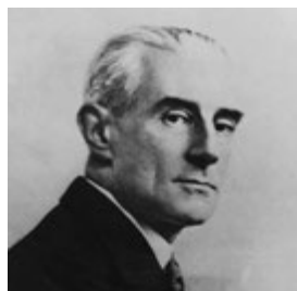
Maurice Ravel (um 1930)