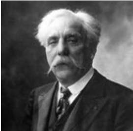
Gabriel Fauré (um 1920)

Die Schauspielmusik ist das einzige Genre, das meinen geringen Möglichkeiten annähernd entspricht!