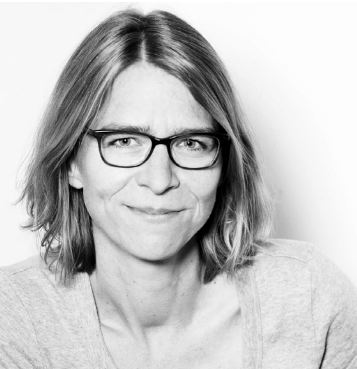
Elke Schuch (Drehbuch)

„In ‚Diebe‘ lässt sich irgendwann gar nicht mehr mit Sicherheit bestimmen, wer denn nun Opfer und wer Täter ist“